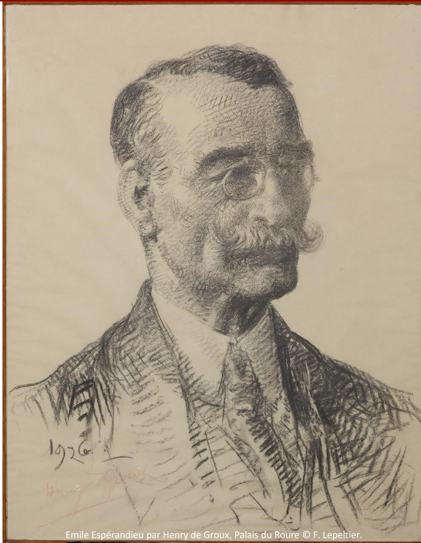
Emile Espérandieu par Henry de Groux, Palais du Roure © F. Lepeltier.

Promenade archéologique autour d'Emile Espérandieu