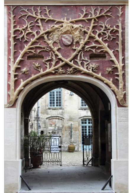
Palais du Roure.

E-mail : musee.calvet@mairie-avignon.com